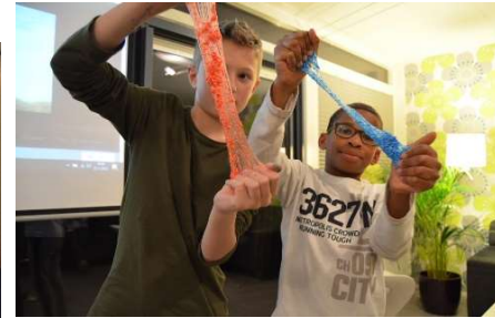
BOEI Kids 9 - 12 Om de week vrijdagavond