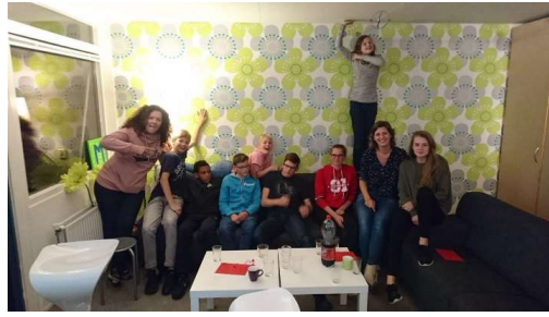
BOEI 10z Om de week vrijdagavond