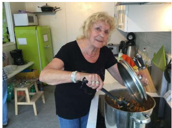
BOEI Eet & Ontmoet Om de week maandagavond