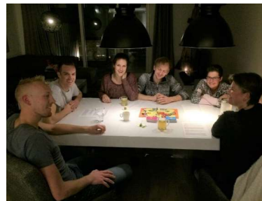
BOEI Connect Verschillende groepen en avonden

Tijdens de bijeenkomst wordt de gehele toespraak opgenomen zodat deze later via de website (terug)beluisterd kan worden. Alles na afloop van de toespraak, zoals luisterlied en gebed, wordt niet opgenomen.