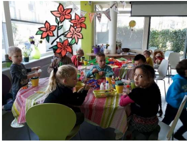
BOEI Kids 4 - 9 1 keer per maand woensdagmiddag